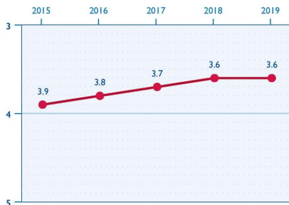
ԻՐԱՎԱԿԱՆ ՄԻՋԱՎԱՅՐԸ ՀԱՅԱՍՏԱՆՈՒՄ

ՔՀԿ-ների գործունեության դադարեցումը կամ լուծարումը շարունակում է մնալ բարդ գործընթաց: Որպես արդյունք գրանցված ՔՀԿ-ների թիվը շարունակում է աճել, քանի որ չգործող կազմակերպությունները շարունակում են գրանցված մնալ ռեգիստրում: Արդարադատության նախարարությունը Պետական եկամուտների կոմիտեի (ՊԵԿ) կողմից տրամադրված ցուցակների հիման վրա լուծարում է այն ՔՀԿ-ներին, որոնք ժամանակին չեն տրամադրել համապատասխան