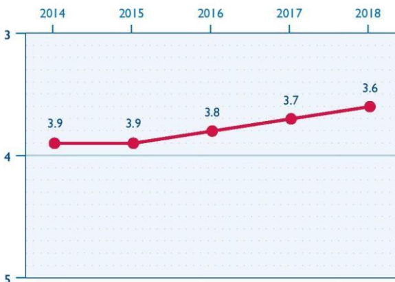
ԻՐԱՎԱԿԱՆ ՄԻՋԱՎԱՅՐԸ ՀԱՅԱՍՏԱՆՈՒՄ

2018 թվականին ՔՀԿ ոլորտը կարգավորող իրավական միջավայրը փոքր-ինչ բարելավվել է պետական կառույցների և պետության անունից հանդես եկող խմբերի կողմից ՔՀԿ-ների և նրանց անդամների նկատմամբ ճնշումների և ոտնձգությունների նվազման արդյունքում: